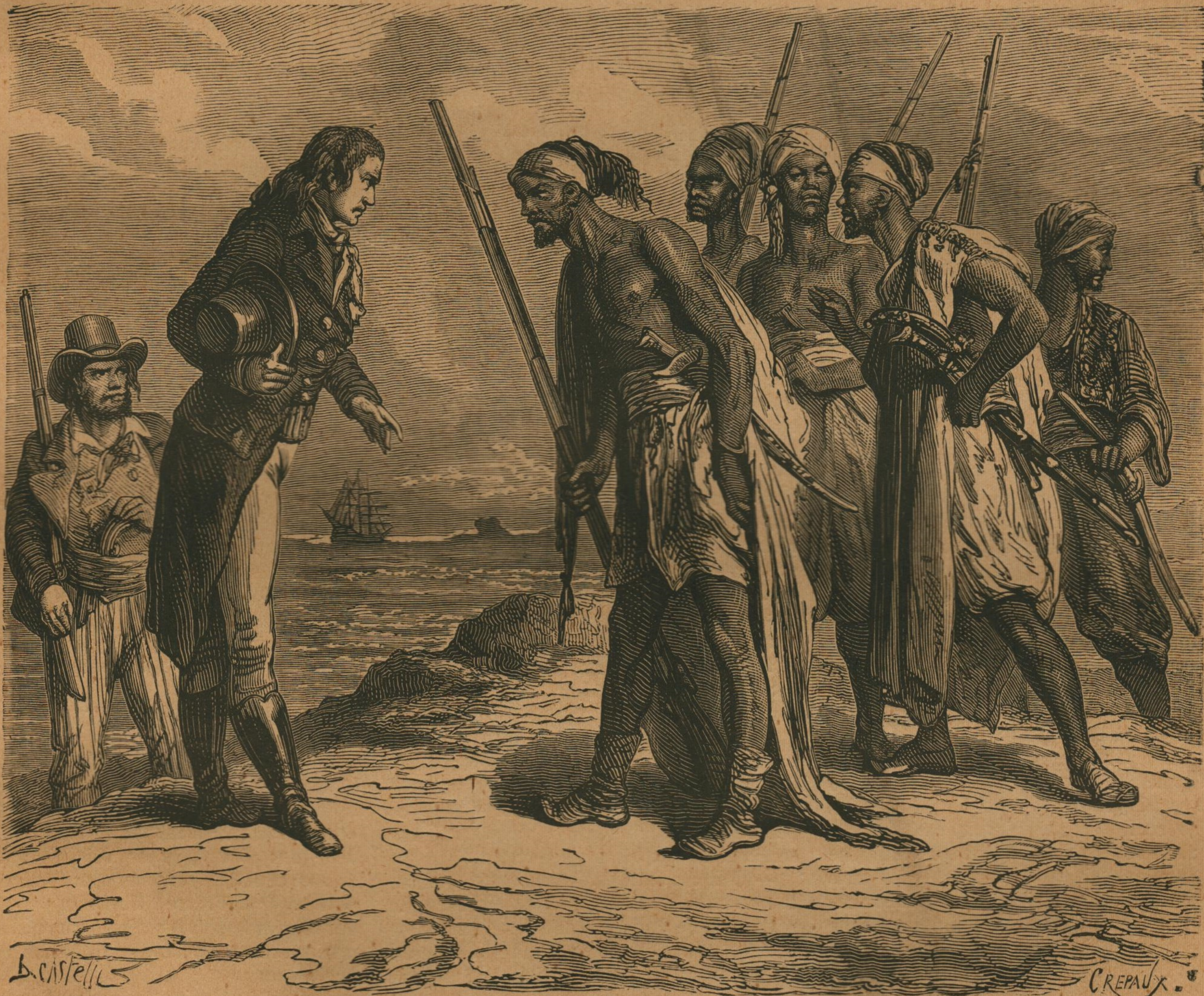
Cinq Malais presque nus et d'un aspect féroce... (Pag. 105.)

LA DAME DU CHATEAU MURÉ, par LA COMTESSE DASH.